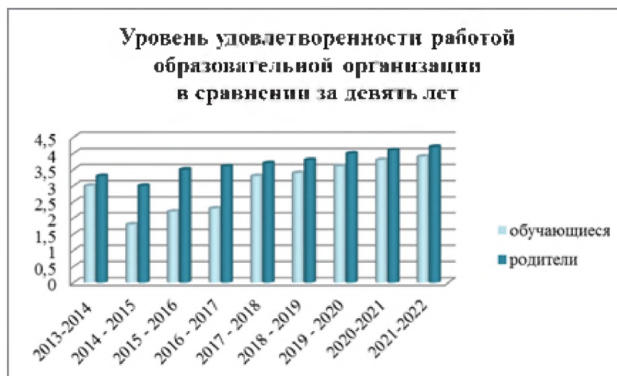
Рис. Уровень удовлетворенности работой образовательной организации в сравнении за девять лет

Показатель уровня удовлетворенности родителей работой образовательной организации возрастает с каждым годом, это самое главное поощрение для всего коллектива образовательной организации. Показатель уровня удовлетворенности учащихся работой образовательной организации так же возрастает в сравнении за последние девять лет. В 2021 – 2022 учебном году качественная работа работников образовательной организации была отмечена директором школы, начальником управления образования администрации г.Радужный, думой г.Радужный, департаментом образования и молодежной политики ХМАО, думой ХМАО.