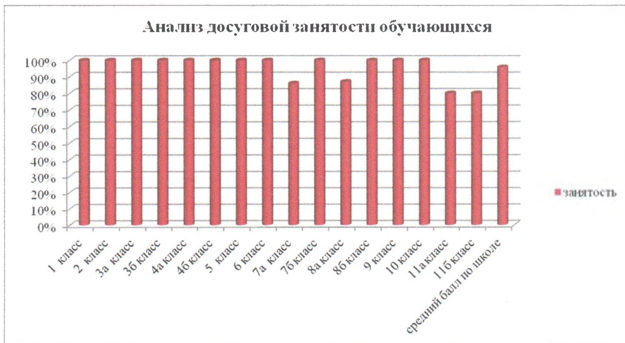
Рис. Анализ досуговой занятости обучающихся