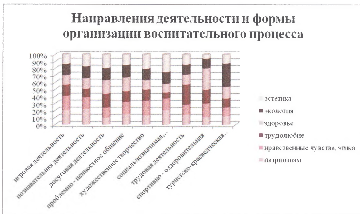
Рис. Направления деятельности и формы организации воспитательного процесса

воспитательной деятельности по приоритетным направлениям представлены в диаграмме (рис).