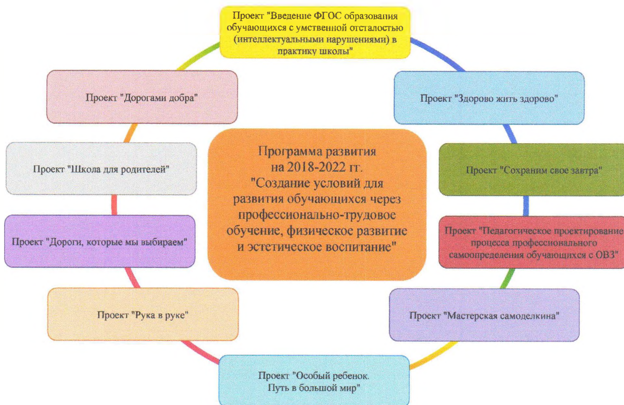
Рис. Реализуемые проекты в рамках программы развития школы

Деятельность в рамках каждого направления Программы является стратегическим ориентиром в управлении инновационным развитием школы.