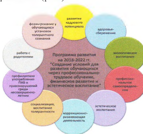
Рис. Приоритетные направления программы развития школы на 2018-2022 гг.

Таким образом, основными направлениями развития образовательной организации определены следующие направления (рис.):