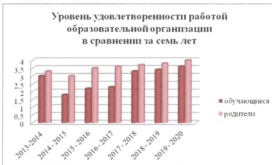
Рис. Уровень удовлетворенности работой образовательной организации в сравнении за семь лет

Уровень удовлетворенности работой образовательной организации представлен на диаграмме (рис.).