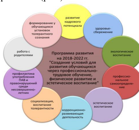
Рис. Приоритетные направления программы развития школы на 2018-2022 гг.

Таким образом, основными направлениями развития образовательной организации определены следующие направления (рис.):