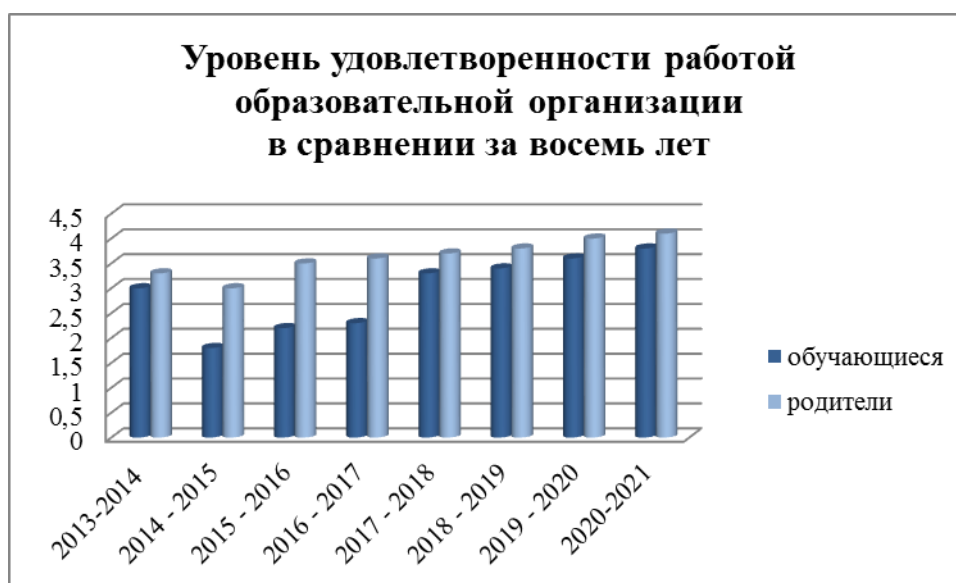
Рис. Уровень удовлетворенности работой образовательной организации в сравнении за восемь лет

Уровень удовлетворенности работой образовательной организации представлен на диаграмме (рис.).