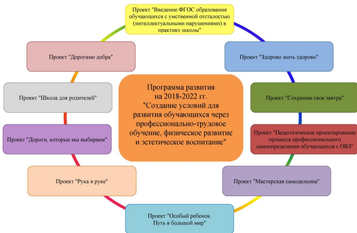
Рис. Реализуемые проекты в рамках программы развития школы

Деятельность в рамках каждого направления Программы является стратегическим ориентиром в управлении инновационным развитием школы.