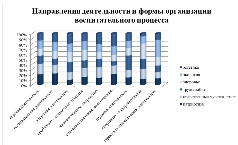
Рис. Направления деятельности и формы организации воспитательного процесса

Организация и планирование воспитательной работы основывались на принципах развивающего образования, позволяющего выстраивать взаимодействие воспитателей, классных руководителей, специалистов, педагогов дополнительного образования и обучающихся через отношения сотрудничества, сотворчества ; эффективно использовать новые приемы, методики и формы воспитания. Все используемые формы организации воспитательной деятельности по приоритетным направлениям представлены в диаграмме (рис).