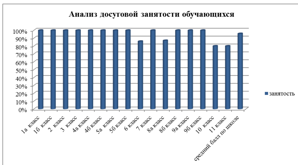
Рис. Анализ досуговой занятости обучающихся